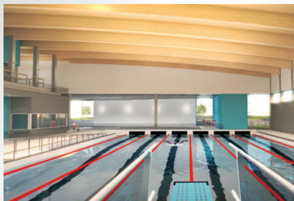
Le bassin principal du futur complexe aquatique sera surplombé de magnifiques poutres en bois.